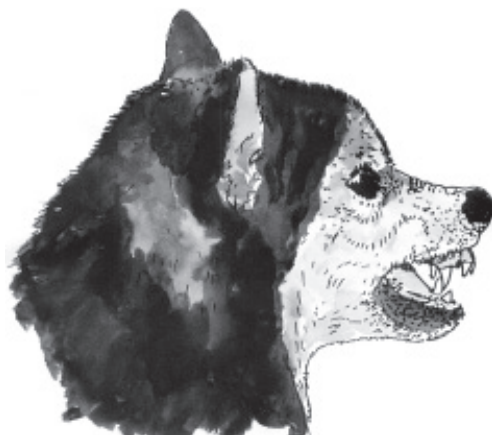
Mimika psa o sterzących uszach wyrażająca groźbę ugryzienia

Uważa się, że mimika zastępuje, czasem w sposób przesadzony, ruchy ciała.