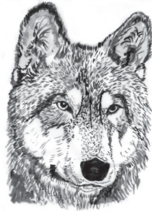
Mimika neutralna u wilka

Kiedy pies gryzie, jego wargi są wywinięte, kły widoczne, a kąci warg odsunięte do tyłu. Mimika wyrażająca groźbę ugryzienia wykorzystuje te same ruchy mięśni.