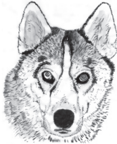
Mimika neutralna u psa rasy husky